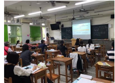
導師介紹學習歷程檔案