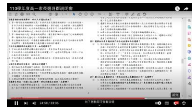
選班群迷思與澄清