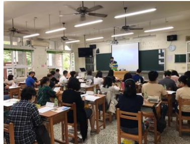
導師說明班級經營原則