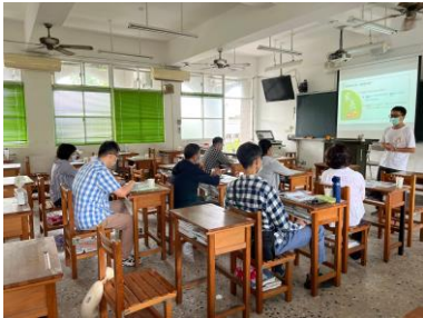
校長介紹辦學理念(Meet)