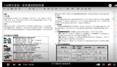
說明心理測驗結果