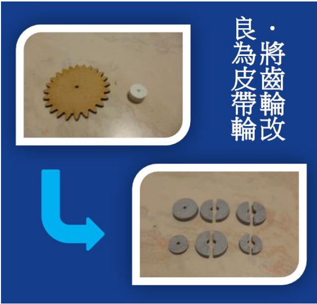
圖 4：雷切仿生獸的發表