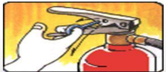
步驟二：拉開安全插銷