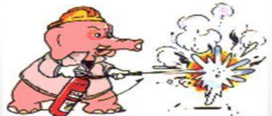
步驟六：左右移動掃射