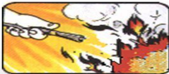
步驟五：朝向火源根部噴