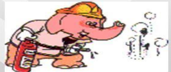
步驟八：保持監控確定熄滅