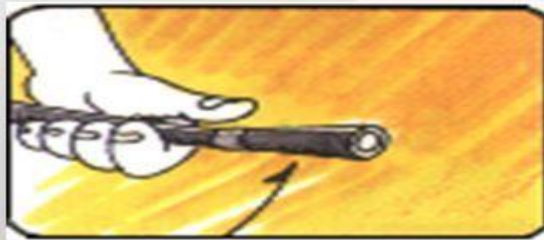
步驟三：握住皮管，朝向火苗