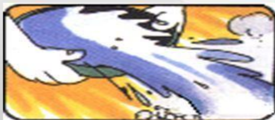
步驟七：熄滅後用水冷卻餘燼