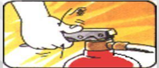
步驟四：用力握下手壓柄