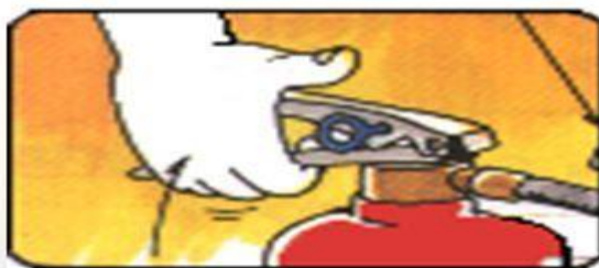
步驟一：提起滅火器