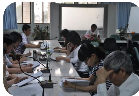
召開 健康促進委員會