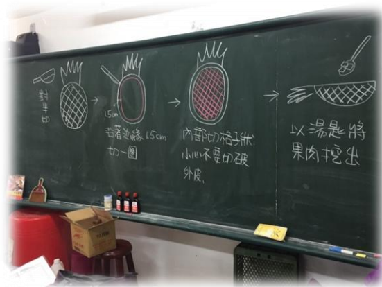
家政課 2:使用當地當季水果製作炒飯