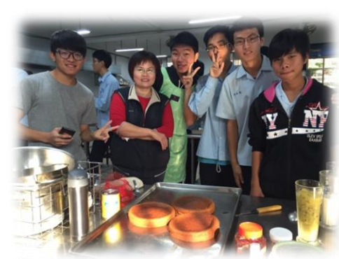
家政課 1:親自動手做蛋糕

本校希望藉由健康促進學校推動過程，營造健康體位優質環境，提升正確體型意識，藉動態生活、實際動手烹飪，注意均衡飲食、提升學生體適能，逐年降低學生過輕及過重(肥胖)之比率，以促進學生身心健康。