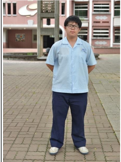
學生短袖制服穿著