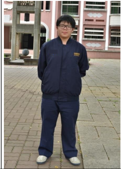
學生長袖制服穿著(著外套)