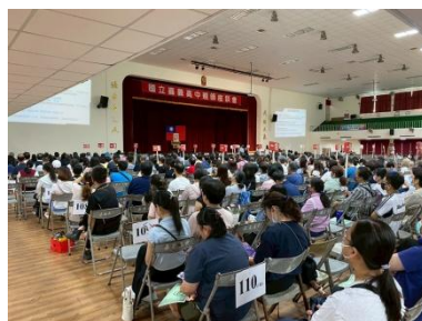
介紹學習歷程檔案