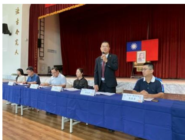
校長說明辦學狀況