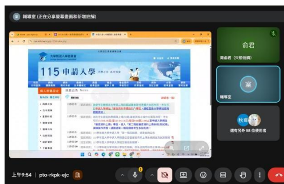
介紹大學甄選委員會