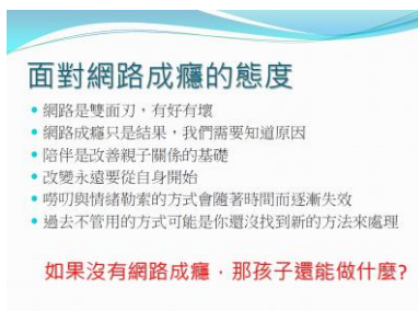
家長如何面對孩子網路成癮