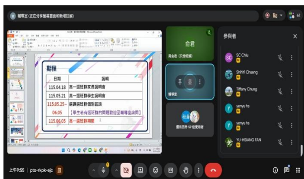
說明選班群考量的時程