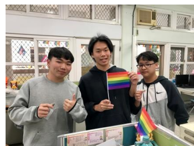
完成挑戰，領取紀念品