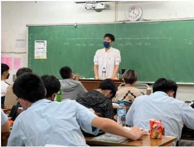
介紹性別平等發展的歷史