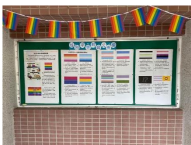
介紹性別平等運動之歷史