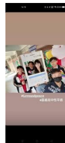
學生限動 PO 文