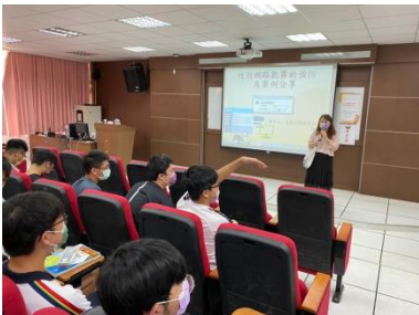
輔導主任介紹講題