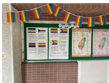
介紹多樣的性別族群