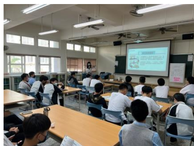
介紹多元性別族群驕傲旗幟