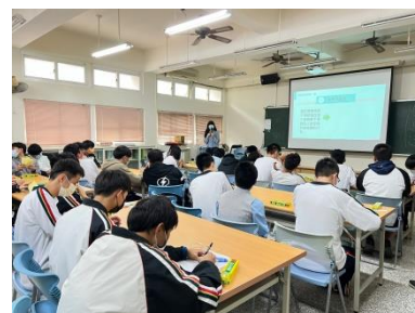
探討與性別少數族群的互動