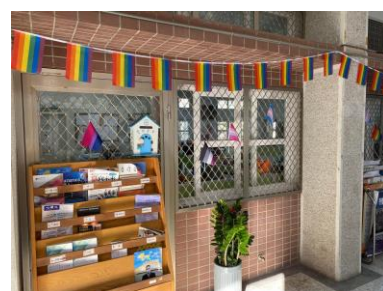
運用不同的彩虹旗布置