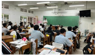
講師分享自身經驗