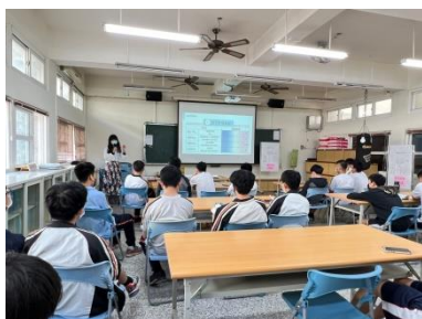
解釋多元性別的概念