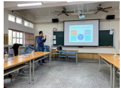
身心障礙者權利公約重點