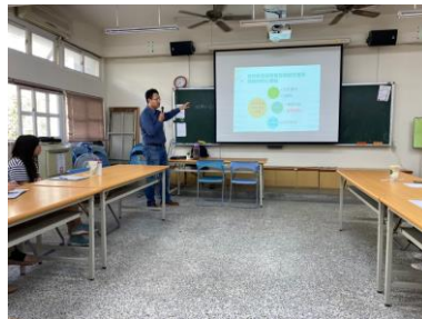
特殊教育核心重點