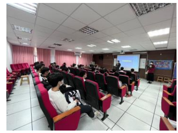
講者說明法規與案例分享