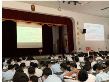
媒體中的性別文化