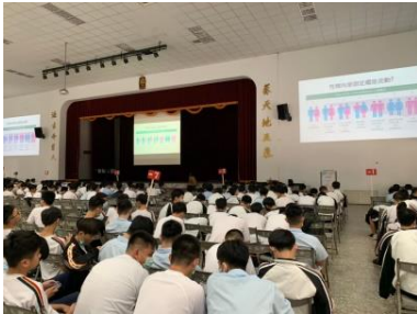
認識多元性別概念