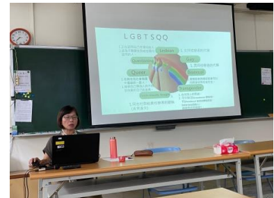
提升教師對於多元性別的理解