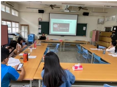
教師專心參與講座